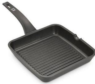
Bistecchiera Induction PRO 8212 000