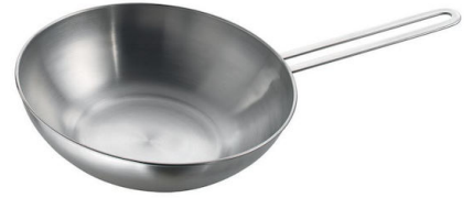
Padella wok con fondo piatto Induction PRO 8211 000