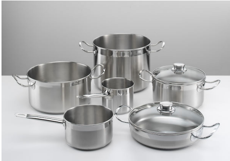
Batteria pentole Induction PRO 8pz. 8210 008